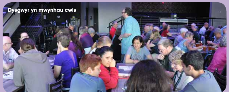
Dysgwyr yn mwynhau cwis

Mae hefyd yn gyfle i'r uned greu cysylltiadau rhyngwladol yn ôl lestyn Llwyd, Rheolwr Busnes a Datblygu'r uned.