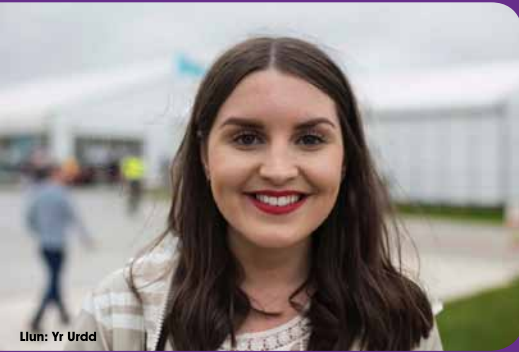
Llun: Yr Urdd

Merch o Aberdâr a raddiodd yn y Gymraeg ym Mhrifysgol Abertawe oedd enillydd Medal y Dysgwyr yn Eisteddfod yr Urdd eleni.